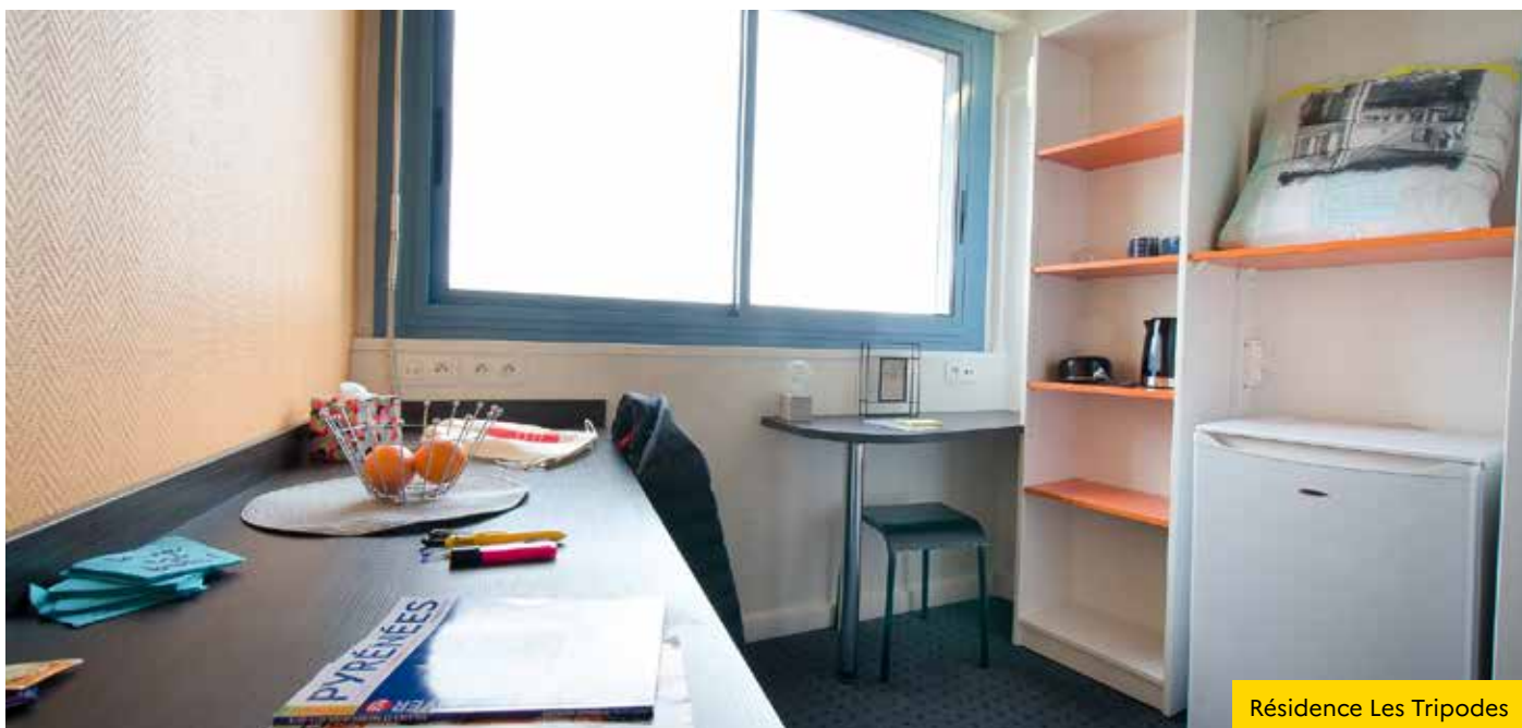
Résidence Les Tripodes